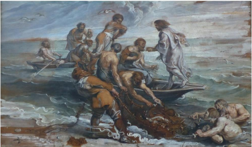
Peter Paul Rubens (1577–1640), Der Wunderbare Fischfang (1618/19)

D er niederländische Maler Rubens hat vor 400 Jahren ins Bild gesetzt, wie dramatisch die Situation damals am See Gennesaret gewesen ist. Eine echte Herausforderung für die Jünger: Wider alle Vernunft werfen sie noch einmal die Netze aus. Und fangen so viel, dass es ihnen nicht nur die Netze, sondern beinahe auch den Verstand zerreit. Das sind die Momente, in denen man auf die Knie fllt und ruft: Mein Herr, mein Gott. Momente der berwltigung. Gott gelingt etwas, was fr unmglich gehalten wurde. Menschen kennen diese Momente: berwltigt von der Liebe; berwltigt von der Schpfung; berwltigt von einem Glck, das, genau betrachtet, reine Gnade ist. Da muss man mit dem Herzen auf die Knie. Dann gibt es nur noch eins: Danke sagen.